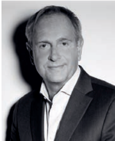
Initiator des Personalforum Energie und Geschäftsführer der EnergyRelations GmbH

D ie digitale Transformation in der Energiewirtschaft nimmt Fahrt auf. Die Integration regenerativer und damit volatiler Energiequellen stellt neue und komplexe Anforderungen an die Infrastruktur der Branche und ihre Geschäftsprozesse. Die Digitalisierung der Energiewelt schafft aber auch neue Möglichkeiten. Und dies auf allen Ebenen: von der Erzeugung über den Handel, die Verteilung von Energie, den Vertrieb bis zu den Arbeitswelten. Auch wenn die Auswirkungen der Digitalisierung je nach Unternehmen unterschiedlich ausfallen, HR muss sich auf die neuen Arbeitswelten einstellen, selbst Kompetenzen in digitaler Transformation aufbauen und sein Rollenverständnis überdenken.